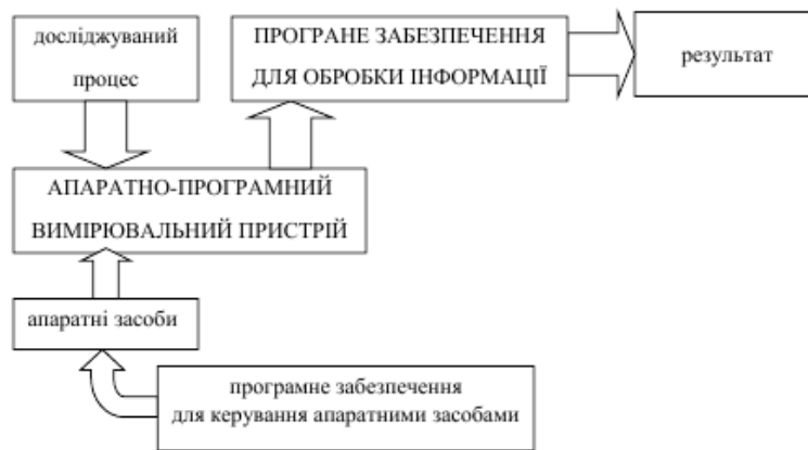
Рис. 2 – Сема застосування інформаційних технологій в трибологічних експериментальних дослідженнях з деталізацією складу програмного забезпечення