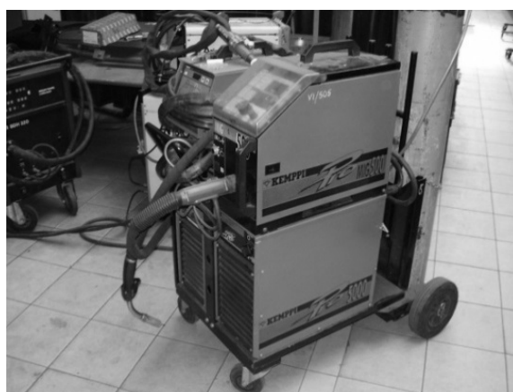
Рис. 2 – Установа Pro Evolution Kemppi

Властивості наплавлених покриттів залежать не тільки від складу наплавленого металу, але також і від технології наплавлення, яка може значно змінити структуру матеріалу наплавлення, що в свою чергу впливає на його продуктивність. Для отримання покриттів було використано метод дугового наплавлення в газовій атмосфері аргону GMA (MAG). Наплавлення проводились на установці Pro Evolution Kemppi, яка представлена на рис. 2.