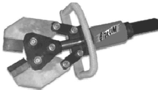
Рис. 1 – Загальний вигляд ножиць Н-32

Одним з перспективних шляхів для підвищення зносостійкості деталей машин і механізмів є створення і нанесення захисних евтектичних покриттів. Пожежна і аварійно-рятувальна техніка та інструмент не є винятком.